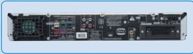
Az üzembe helyezés a szinkódos csatlakozóknak köszönhetően egyszerű, azonban a szűkre szabott csatlakozókínálatból hiányzik a progresszív videó kimenet

Sokoldalú házi mozi rendszer ál-surround hangzással és rugalmas 5.1-es hangszár- zó pozicionálással. Minden tekintetben jó csomag, amely DivX, MP3, WMA és JPEG lejátszást is kínál