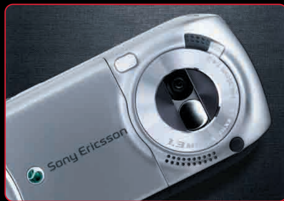
A Sony Ericsson S700i hátoldala szinte teljes egészében a digitális fényképezőgépeket idézi

adatátviteli feladatokat ellátó infra portot, illetve a billentyűzár kapcsolót találhatjuk meg. A hátlapon a kétirányba szétnyíló lencsezár mögött helyezkedik el a kamera objektívje, e fölött balra kapott helyet a beépített vaku, míg a kamera-rész bal alsó szekciójában helyezkedik el a készülék hangszórója. A telefon alján kapott helyet a már