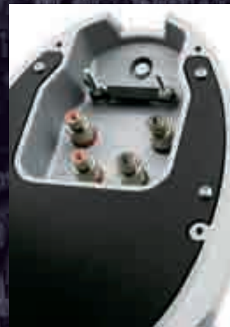
A hangfalkábel csatlakozókat a hangsugárzók alján találjuk. Mi sem természetesebb, minthogy a Signature Diamond kettős kábelezésre is lehetőséget biztosít.

A Bowers & Wilkins Signature Diamond modelljét 2007 márciusától kezdték el gyártani, amelyből a 2008 decemberéig tartó