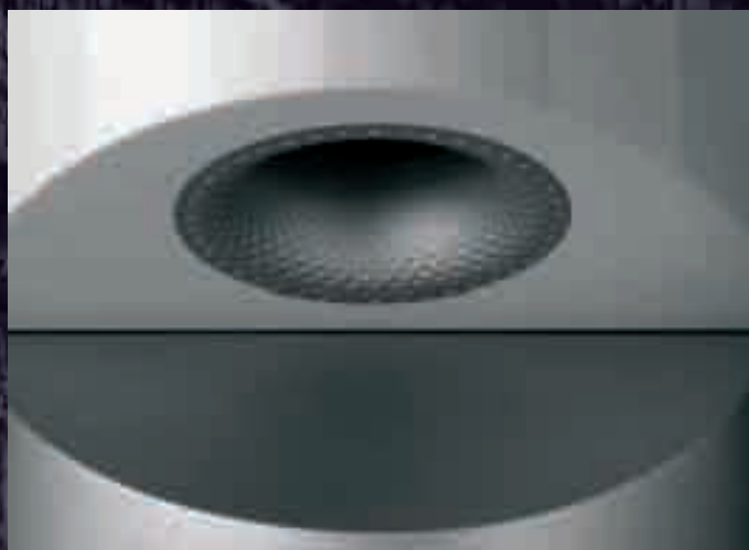
A Signature Diamond bass reflex nyílása a doboz frontjának alján lefelé sugároz. Természetesen ennél a modellnél is a jól bevált Flow Port megoldást alkalmazzák.

A Signature Diamond két utas, bass-reflex kivitelű állódoboz, amelynek hangszórókészletét egy speciálisan ehhez a do-