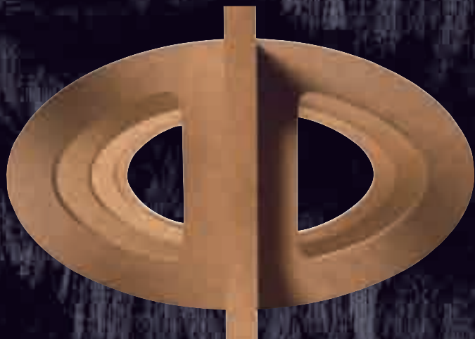
A Signature Diamond speciális Matrix merevítőváza gondoskodik a működés közben kialakuló rezgések tökéletes semlegesítéséről

nevű fafurnér burkolattal. Ez utóbbi létrehozásában meghatározó szerepet játszik egy olasz fáfeldolgozó cég, az Alpi. Különleges furnérmetsző és -kezelő eljárásaik végeredményeként jön létre ez a japán tengeri hínárt (wakame) utánzó mintázat. A magassugárzó kamrája ezekhez a burkolatokhoz illeszkedően ügyszintén kétféle márványból készül. A zongoralakk-fehér változat esetében Olaszországból, Pisa közeléből származó Grigio Carnica márvány, míg a sötét Wakame burkolattal rendelkező Signature Diamond modelleknél a belga fekete márvány adja az egyedi mintázatot, amely minden egyes hangdoboznál eltér.