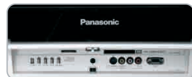
Az elől található S-Video bemenetet egy PC csatlakozó is kiegészíti

A három jelenlegi plazma-ász (a Hitachi 42PDS200, a Pioneer PDP-435 és a Panasonic Viera) között rendkívül nehéz a választás, ezért könnyítsünk egy kicsit a dolgon. A Hitachi jó minőségű forrásokkal nagyszerűen mutat, más anyagokkal azonban nem elég konzisztens. 1 200 000 Ft-os árával ugyanakkor nagyszerű ár/érték arányt képvisel, így akinek szűkösek a keretei, annak tökéletesen megfelel. Aki kicsit messzebbre is tud nyújtózkodni, annak a Panasonic-ot és a Pioneer-t érdemes fontolóra vennie. De mi alapján válasszunk közülük? Véleményünk szerint egy dolgot kell eldönteni: alacsonyabb ár és jobb feketereprodukció (Panasonic) vagy jobb definíció és hangzás, valamint HDMI bemenet (Pioneer).