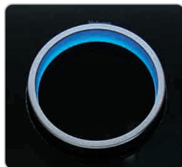
A tetszetős, kék fényben pompázó hangerőszabályzó ma már megszokott formaelem

Az erősítés testes, de nem izmos. A gyártó szerint a hét nagyteljesítményű erősítő mindegyike 110 W kimenő teljesítményre képes 8 Ohm esetén, amennyiben az összes csatorna működésben van. Kétcsatornás sztereó üzemmód esetén pedig a 125 W-os értéket egészen kiemelkedő... Méréseink során mi még ennél is lenyűgözőbb eredményeket kap-