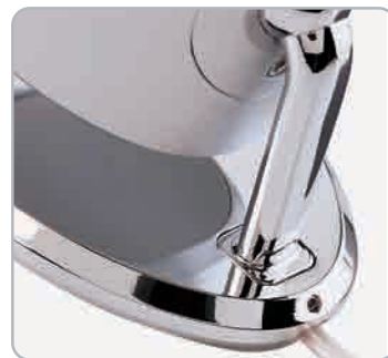
A gömbcsuklóban végződő tartóelem és a hangsugárzó talp szerkezeti kialakítása kultúrált kábelvezetést biztosít a keresztváltók felé.

Az AS2 mélyhangdoboz azonban már korántsem ilyen tetszetős és masszív. Bár néhány ívelt vonalat itt is találunk, hogy legyen némi formabéli összhang a szatellitokkal, aki igazán szép modellre vágyik, annak 210000