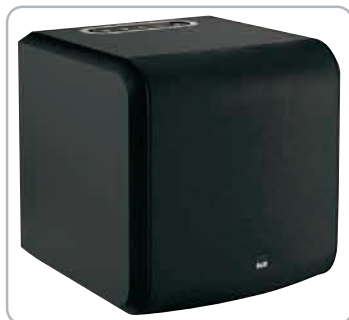
Az AS2 szub – az M-1 szatellitkehez hasonlóan – teljesen új produktum a brit hangszugárzógyártó termékínálatában.

letgazdagsága is megmarad a dialógusok apó finomságainak kellő hatással történő meg-