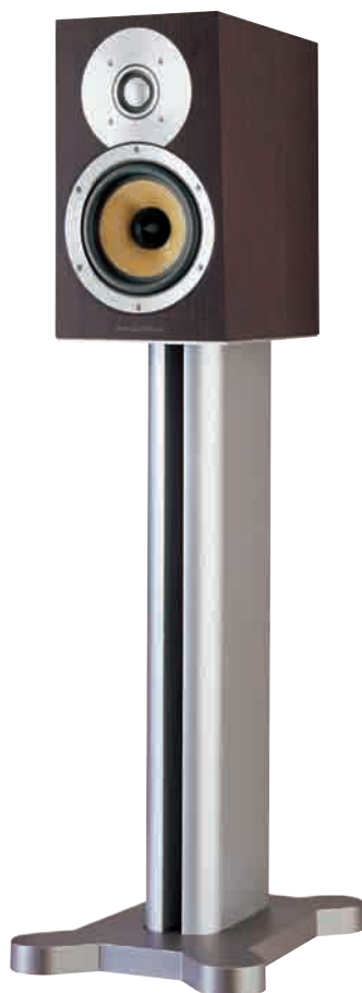
A gyártó az ideális hangkép eléréséhez az ezüst, illetve fekete kivitelben készülő FS-700/CM típusú hangsugárzó állványát javasolja a CM 1 dobozoknál is.

tést nyújtott az énekesnő határozott, dinamikus hangja számára. Az egyes instrumentumok hangja jól elkülönült egymástól. A sztereó kép jól fókuszált, inkább magasságában, mint szélességében volt kiterjedt, bár ez utóbbi nem róható fel hibának, mivel ezek a dobozok elsősorban kisebb szobákban vannak igazán elemükben, míg mi, a tesztünk során egy kb. 100m 2 alapterületű, nyitott légterű helyiségben hallgattuk. Ezek után többfajta klasszikus zenei felvétellel „vizsgáztattuk” a szettet, amelyekkel megint csak elemében érezte magát a doboz. A hegedűjátéka finom és kellőképpen részletező, míg az aláfestő zongora hangja kellemesen telt. Nagyzenei műveknél, meglepő módon megfelelő a dinamika, talán kissé kicsi a színpad nagysága, de ennek okát már részleteztük az előbbieken. A hangszeres megfelelő módon szólalnak meg, nem tolakodóak, illetve kirívóak, ami a CM 1 esetében tapasztaltakkal ellentétben, sajnos előfordulhat ilyen kisméretű hangsugárzóknál. A mély-közép és magas hangok egymáshoz viszonyított arányai kifejezetten jók, így bátran merjük ajánlani klasszikus akusztikus műfajoknál is.