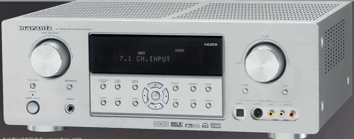
A rádióerősítő külsőre ugyanolyan, mint az SR5001 típusú drágább testvére, súlya azonban egy kg-mal kevesebb