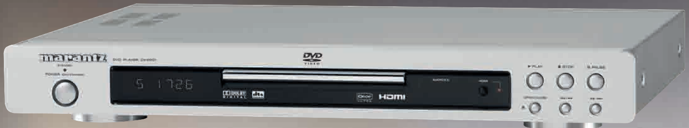
Az elegáns DV4001 DVD-lejátszó szolgáltatáskínálata figyelemreméltó, a kimenetek sorában egyebek mellett egy HDMI port is megtalálható